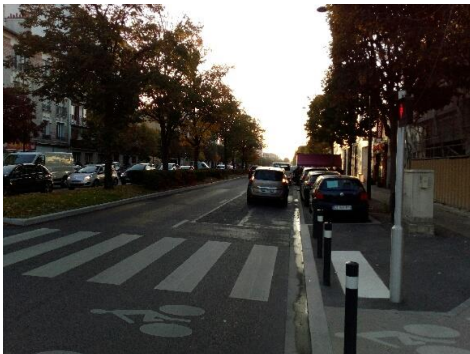
Une seconde voie de luxe qui sert surtout de dépose-minute...

C'est une solution qui était et reste tout à fait possible vu l'utilisation actuellement faite des voies supplémentaires (arrêts et stationnement...).