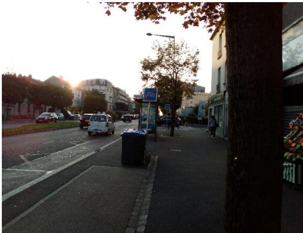
Attention, vous entrez dans une zone de non-droit... la suite 20 mètres plus loin.

La solution était pourtant simple et bien moins onéreuse qu'en l'état : supprimer une voie « voitures » et dispatcher la bande disponible pour créer 2 pistes cyclables de chaque côté de la route et qui en soient bien séparées par des bordures, douces côté piste pour limiter les risques, abruptes côté route pour éviter les stationnements gênants et illégaux.