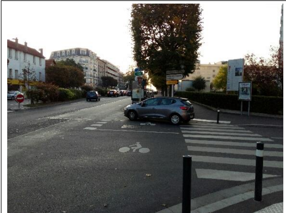
Qui est prioritaire ? Le cycliste qui s'insère et vient de la voie prioritaire ou la voiture qui vient de droite ? Evidemment, avec une vraie piste c'eût été plus simple...

Par exemple, les insertions de cyclistes en provenance de la route principale ne semblent même pas imaginées par les concepteurs (mais savent-ils seulement ce qu'est un vélo ?). C'est notamment le cas au niveau du croisement entre la RD 19 et la rue Carnot.