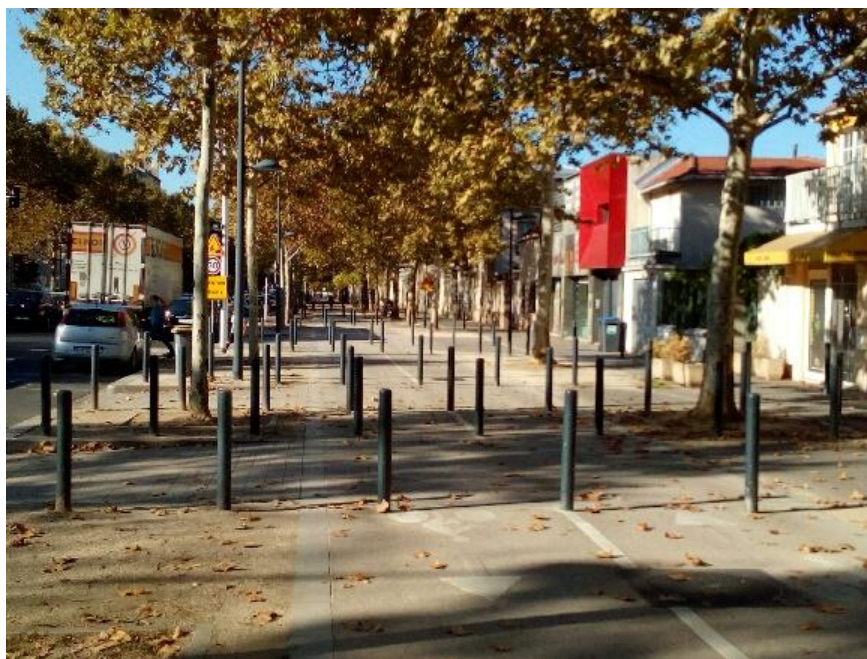
Une véritable piste de slalom !

Je remarque ensuite que si du mobilier urbain était installé pour « régler » ce dernier problème, il ne constituerait au final qu'une nouvelle source d'obstacles et de dangers pour les cyclistes. C'est d'ailleurs déjà le cas sur la voie parallèle que constitue la D6